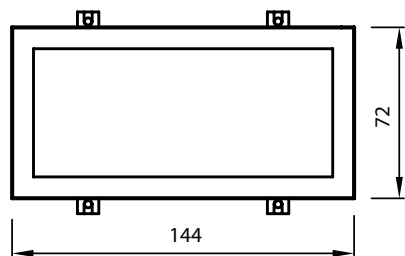
Dimensions en mm